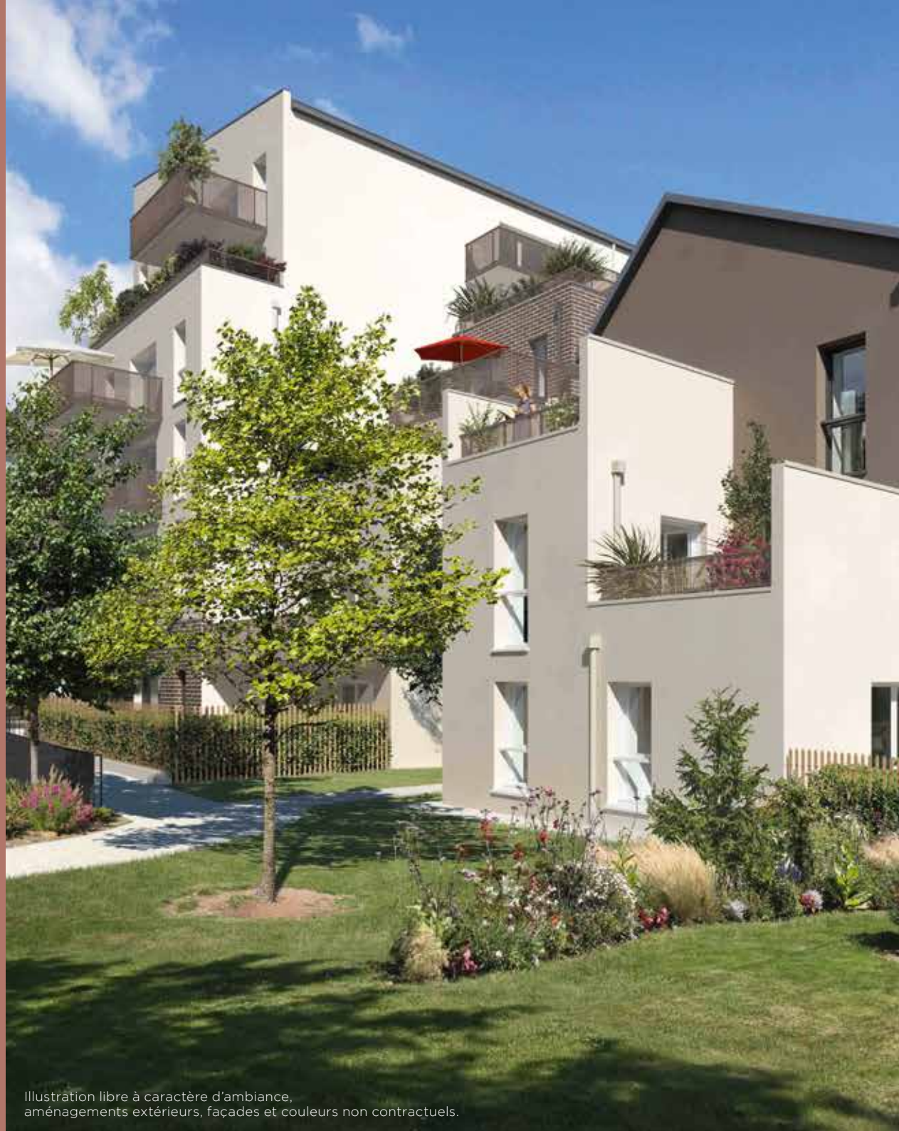
Illustration libre à caractère d'ambiance, aménagements extérieurs, façades et couleurs non contractuels.