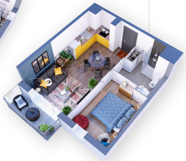
Exemple 2 pièces