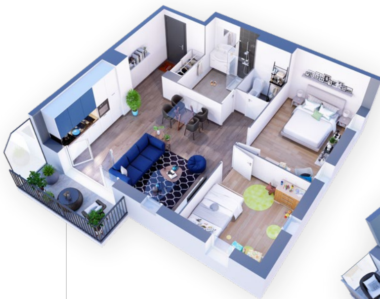
Exemple 3 pièces