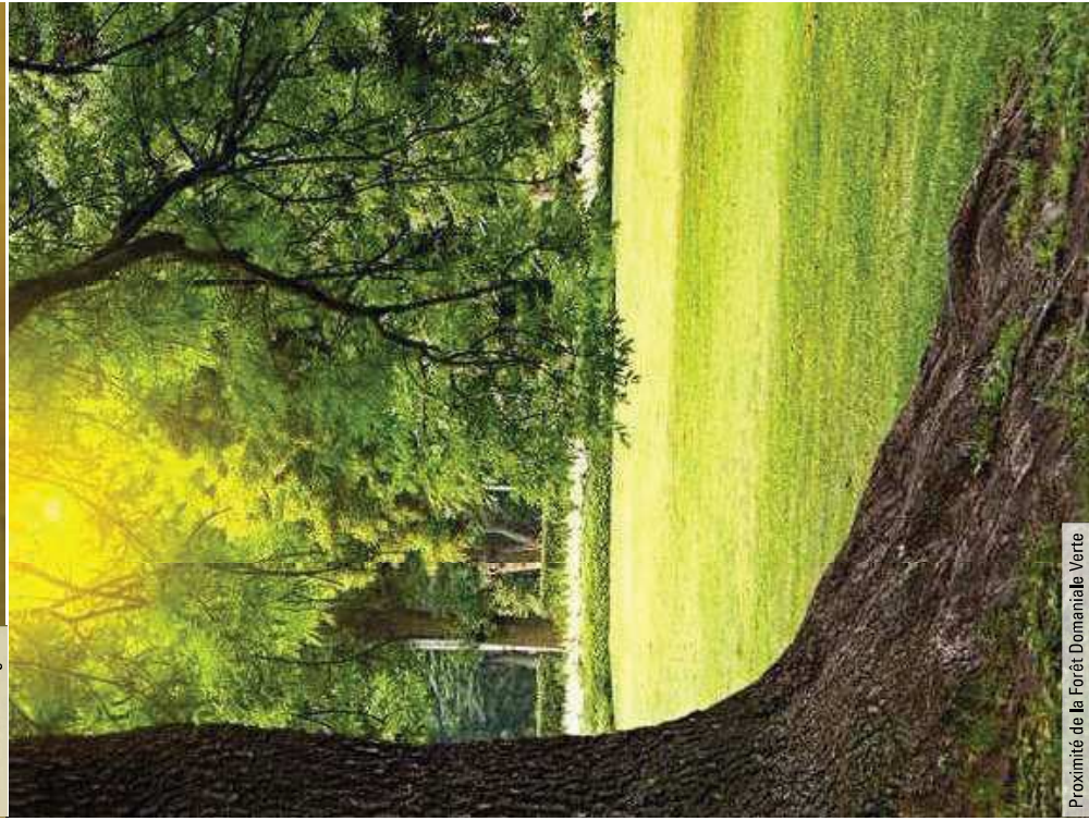
Proximité de la Forêt Domaniale Verte