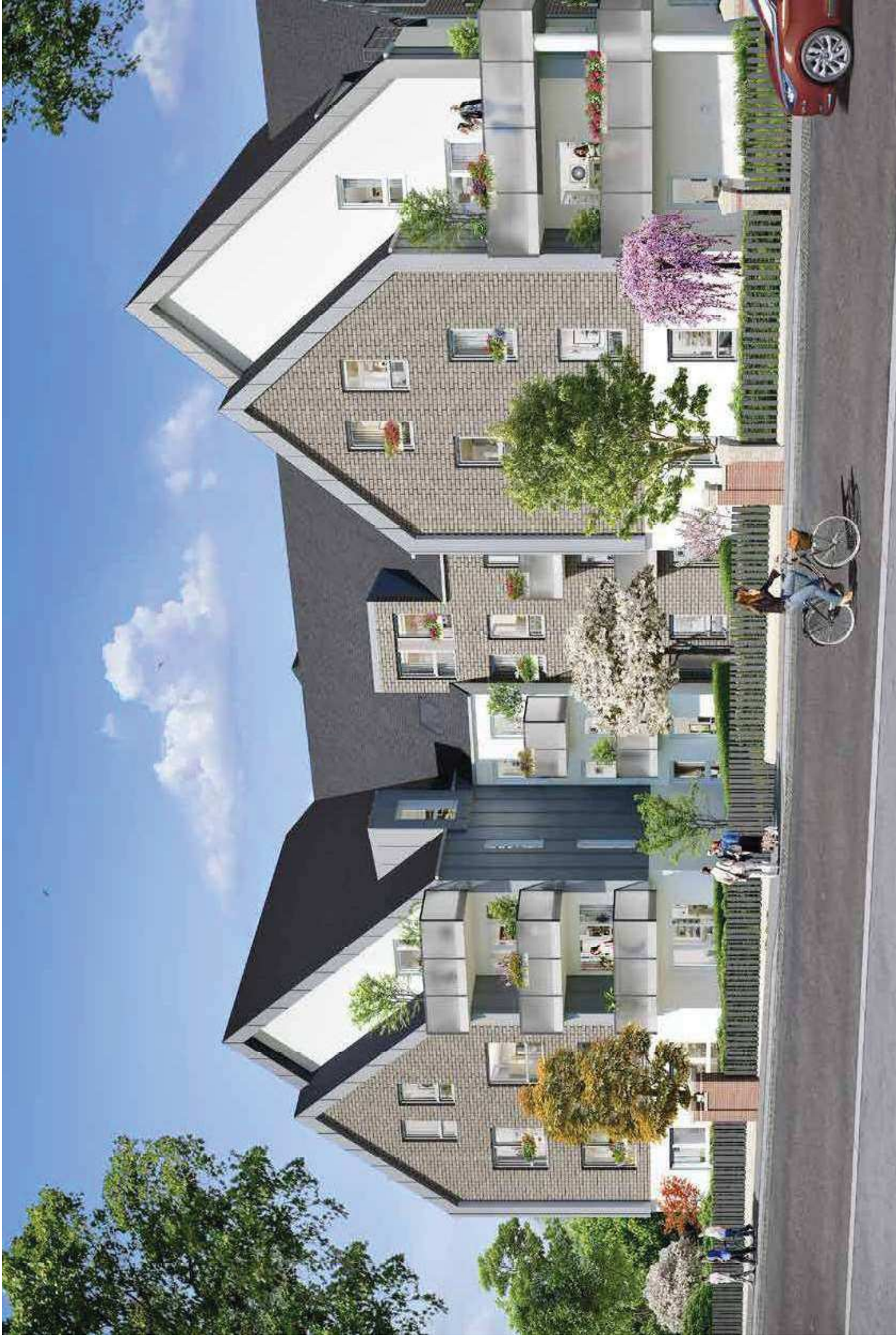
Vue depuis la Route de Neurchâtel