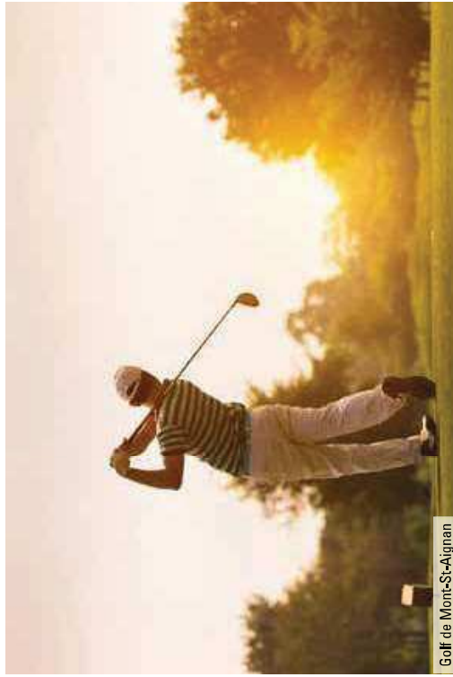
Golf de Mont-St-Aignan