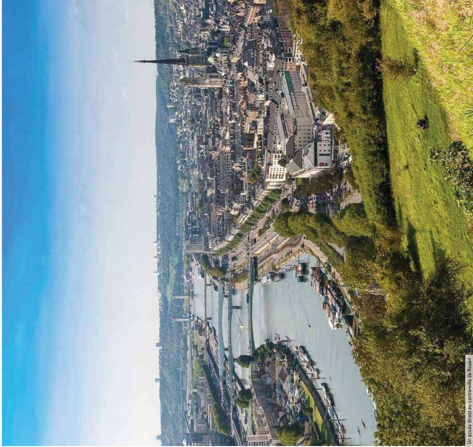
Un accès direct au centre-ville de Rouen