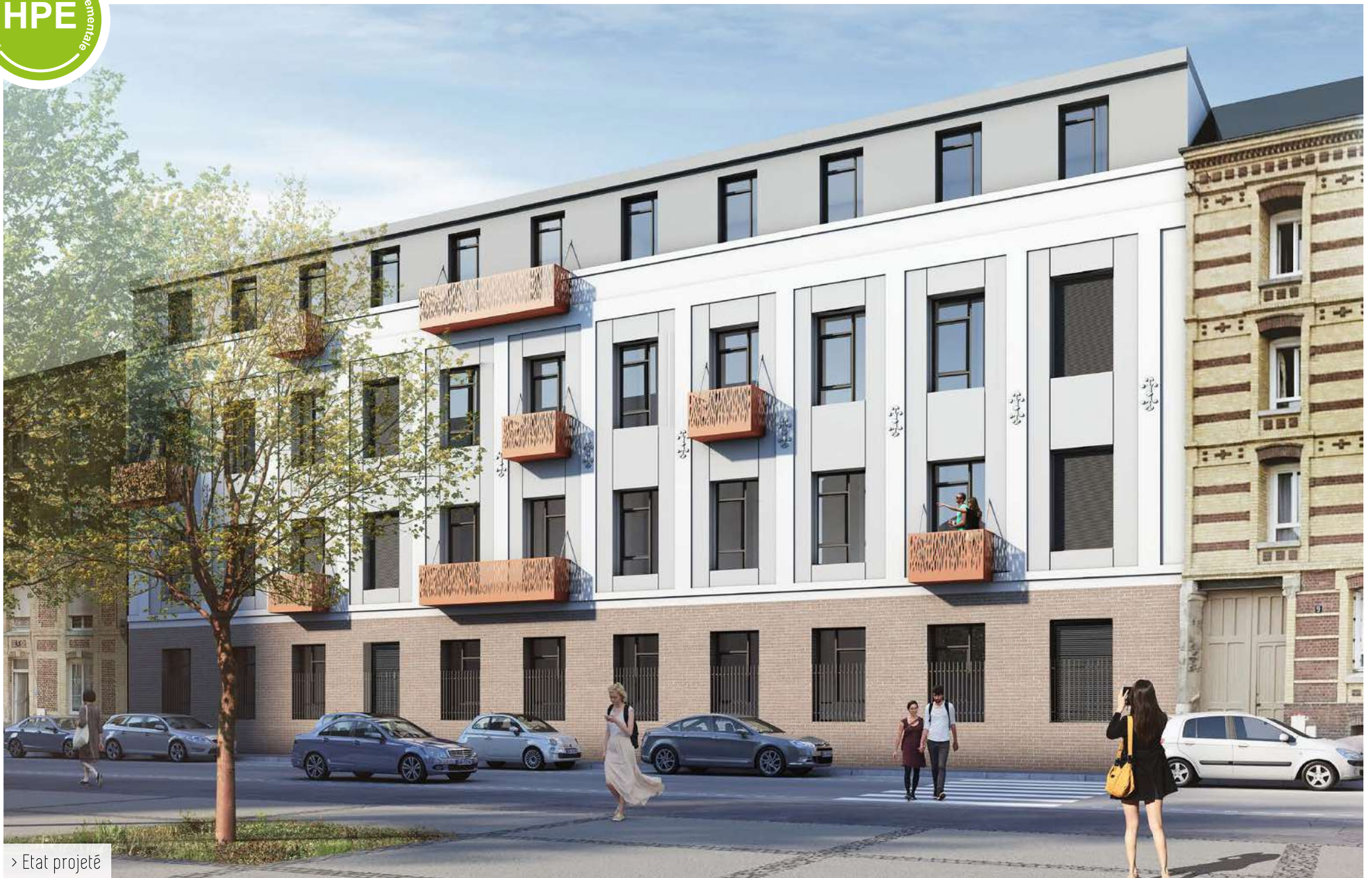
> Etat projeté