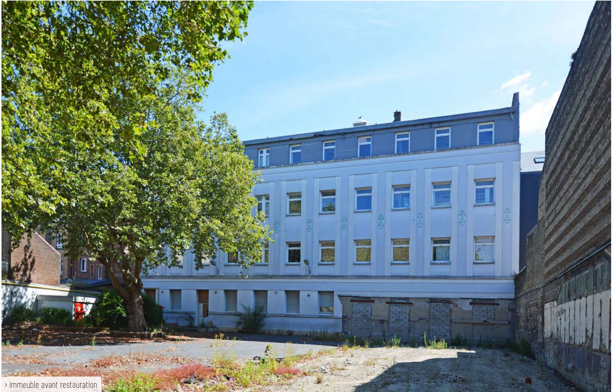
> Immeuble avant restauration