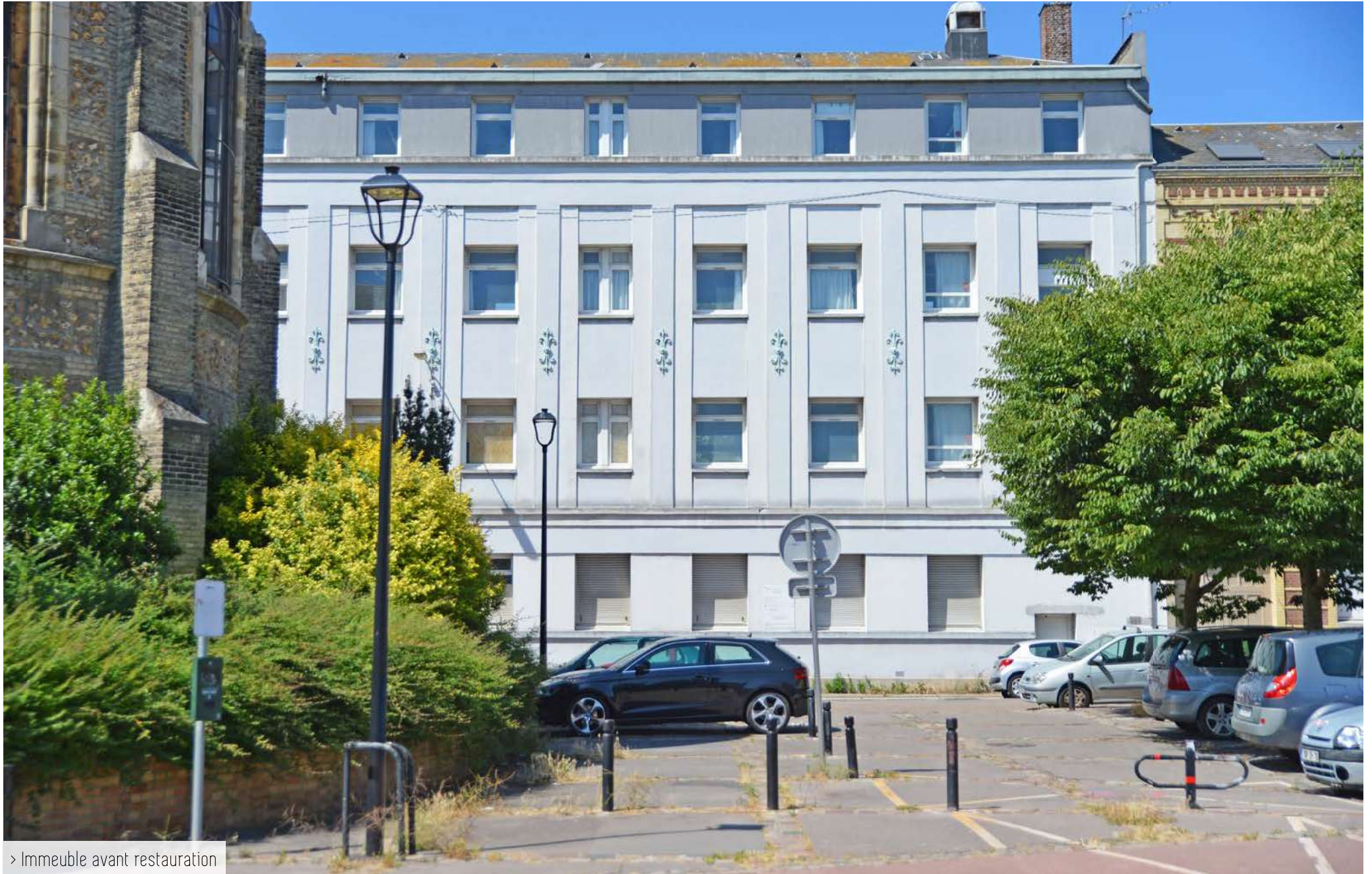
> Immeuble avant restauration