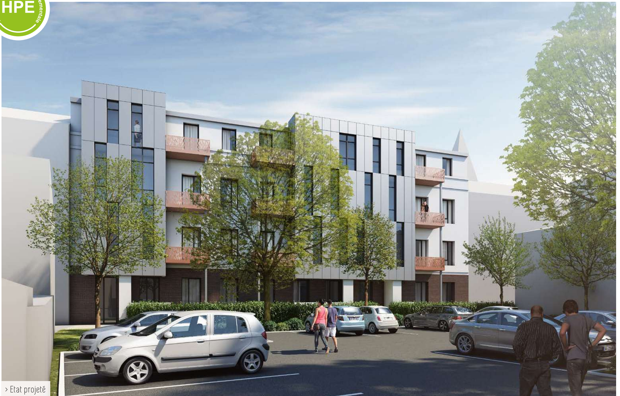
> Etat projeté